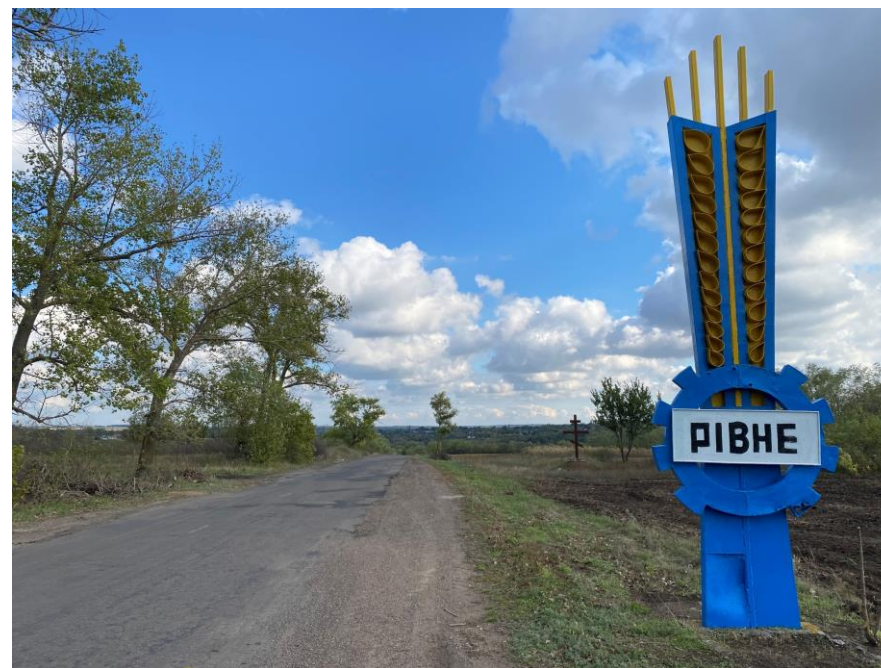
Въезд в село. Знак и православный крест на заднем фоне